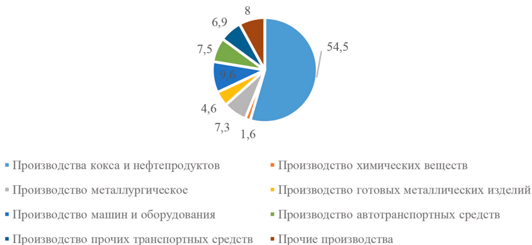
Рис. 2. Структура просроченной кредиторской задолженности организаций обрабатывающих производств в 2020 г., %

ства в будущем. Можно выделить следующие виды устойчивости: финансовую, маркетинговую, производственную, социальную и экологическую. Рассмотрим подробнее финансовую и экологическую устойчивость и обозначим факторы, на нее воздействующие. В финансовой устойчивости основные факторы, актуальные на сегодняшний день: экономическая политика государства, колебания валютных курсов, уровень инфляции, но можно еще выделить требования кредиторов, изменение налоговой системы государства, качество продукции, сезонность поступления денежных потоков от различных видов деятельности и банкротство должников. В условиях постпандемийного периода Covid-19 и экономических санкций в отношении России, которые были введены недружественными странами, наблюдаем, что ряд организаций приостановили деловые отношения и перестали инвестировать денежные средства, произошло прекращение поставок необходимого оборудования, например катализаторов основных процессов нефтепереработки, паровых и газовых турбин, трансформаторов. Финансовая устойчивость определяется с помощью коэффицентного, сравнительного и факторного методов. Остановимся на оценке