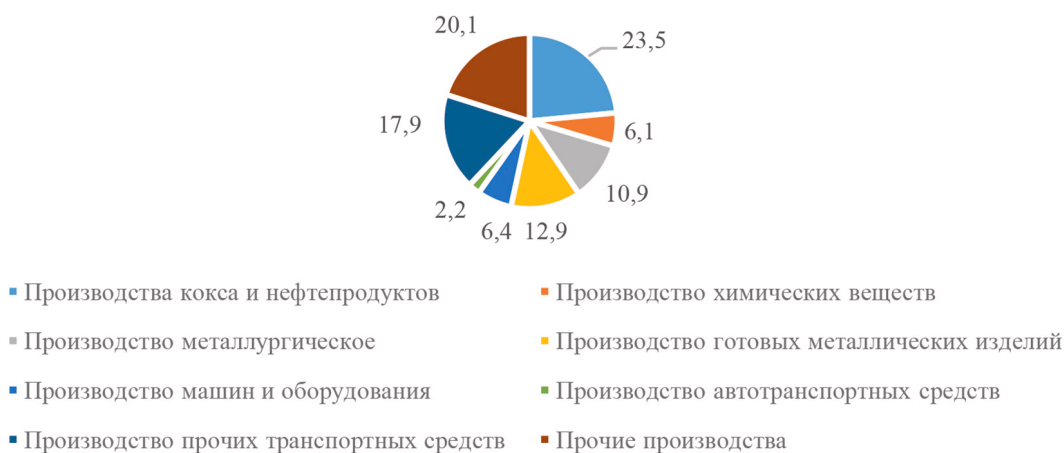
Рис. 1. Структура просроченной дебиторской задолженности организаций обрабатывающих производств в 2020 г., %

Анализируя пассив бухгалтерского баланса организаций, обрабатывающих производств видим, что имеются заемные средства долгосрочного и краткосрочного характера, но преобладает именно кре-