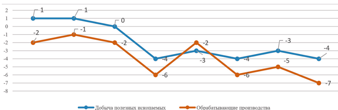
Рис. 4. Индекс предпринимательской уверенности организаций по видам экономической деятельности за последние два года, %